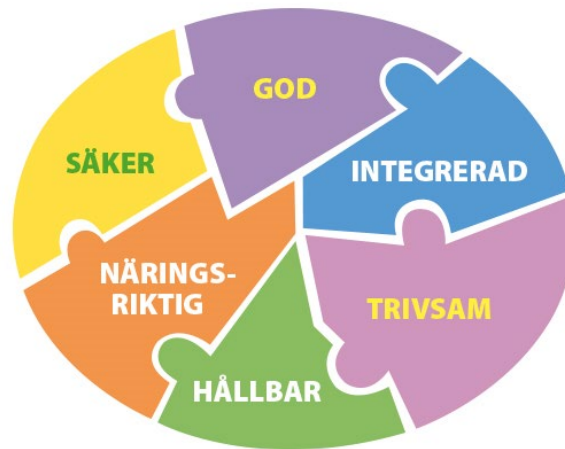
Figur 1 Måltidsmodellen från Livsmedelsverket